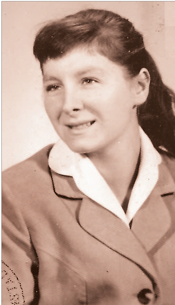
En una foto de carnet de estudiante, aproximadamente a los 21 años de edad.

Por una parte se hallan las agencias de desarro-